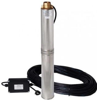
čerpadlo BCPE 1,6 - 40U