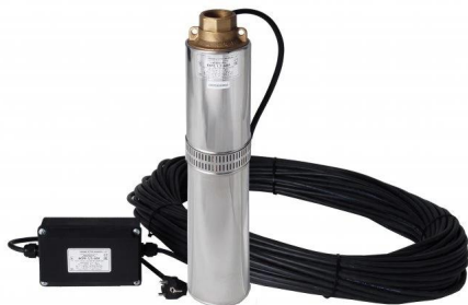
čerpadlo BCPE 1,2 - 40U