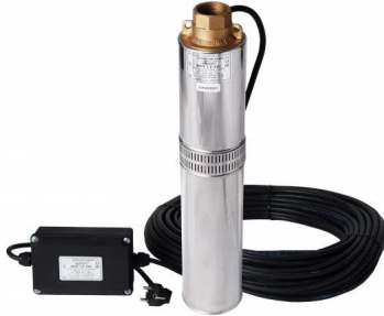
čerpadlo BCPE 1,2 - 25U