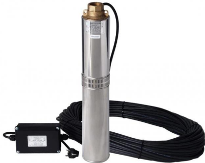
čerpadlo BCPE 0,32 - 32U